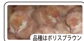
品種はボリスブラウン